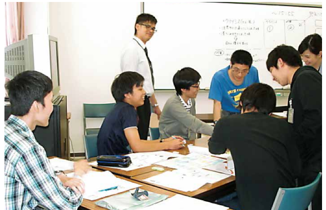
▲知的障がいのある社員の就労支援に関する社内講習会。就労に必要な知識を身に付けるだけでなく、障がいのある社員同士の繋がりをつくるための機会となっています。