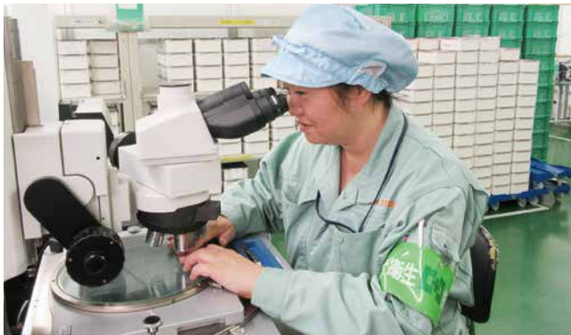
▲班長として班を取りまとめ、活躍しています。