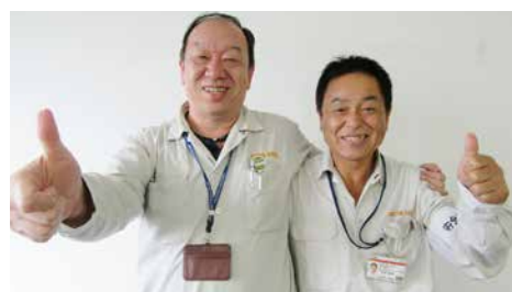
◀長年培った技術を生かし、後進の指導育成に励んでいます。

当社では、高い就労意欲を持った社員が、定年退職後も年金受給開始まで継続して働くことができる、「ナイスシニア制度」を設けており、制度適用者が各職場にて、技能伝承・後輩指導に努めています。また、高齢者がイキイキと働けるように、働きやすい作業環境の整備や、処遇の見直し検討などを進めています。