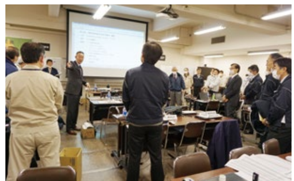
▲「1.8」事故の全社対策本部にて、リーダーとして先頭に立つ。

「1.8」の事故によって、お客様に大変なご迷惑をおかけしてしまったわけですが、見方を変えれば、我々のつくっている製品は、トヨタグループの中でという範疇だけでなく、日本のモノづくりにおいて大きな役割を果たしている、ということです。それを従業員も再認識したのではないのでしょうか。そこで「もう一度、ゼロからの再出発で、お客様にとっていい会社になっていこう」と皆に訴えました。現在ステップアッププランとして、全社一丸となって様々な改革を行っていますが、事故で得た教訓や学びを真の意味で定着させるべく、私が先頭に立って皆を引っ張っていきたいと思います。