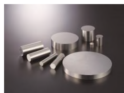
3)高圧水素用ステンレス鋼