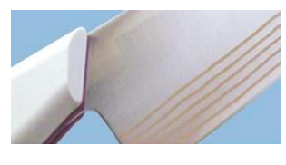
5)クラッド鋼(製品例:包丁)