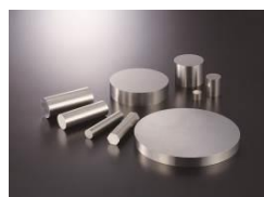
3)高圧水素用ステンレス鋼