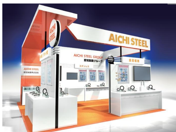
<展示ブースイメージ>

当社は、グループ会社のアイチ テクノメタル フカウミ株式会社と共に、「 素材の可能性を追求し、新しい価値を創造する 」をコンセプトに、素材を軸とした製品・技術およびその採用例を展示します。