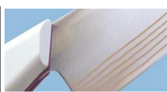
5)クラッド鋼(製品例:包丁)