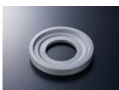
4)高機能特殊鋼(リングギヤ)