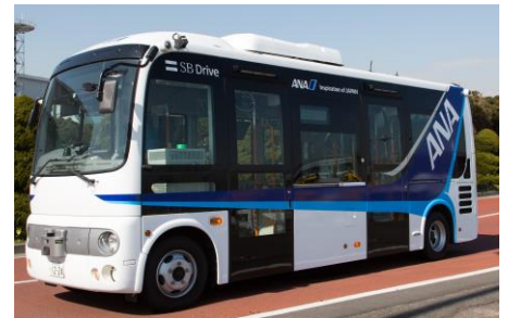
実証実験で使用する自動運転バス

なお、この実証実験は、「航空イノベーションの推進」と「地上支援業務の省力化・自動化」に向けて、国土交通省が全国4つの空港で実施する、空港制限区域内における乗客・乗員などの輸送を想定した国内初の自動走行実証実験の一環として実施するものです。