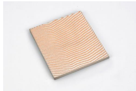
左から 出品するペーパーナイフ、カトラリーレスト（スプーン・フォークを除く）、素材サンプル