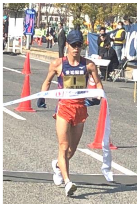
今年2月の日本陸上競技選手権大会