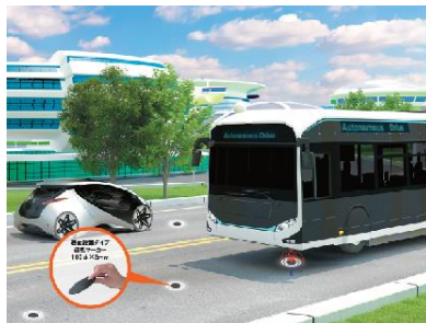
磁気マーカシステム (GMP S) オンラインサイト出展イメージ