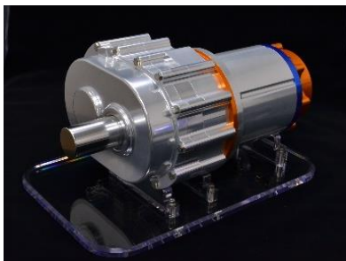
電動アクスル(e-Axle) コンセプトモデル

※3 ご参考：GMP S当社オリジナルウェブサイト https://www.aichi-steel.co.jp/smart/mi/gmps/